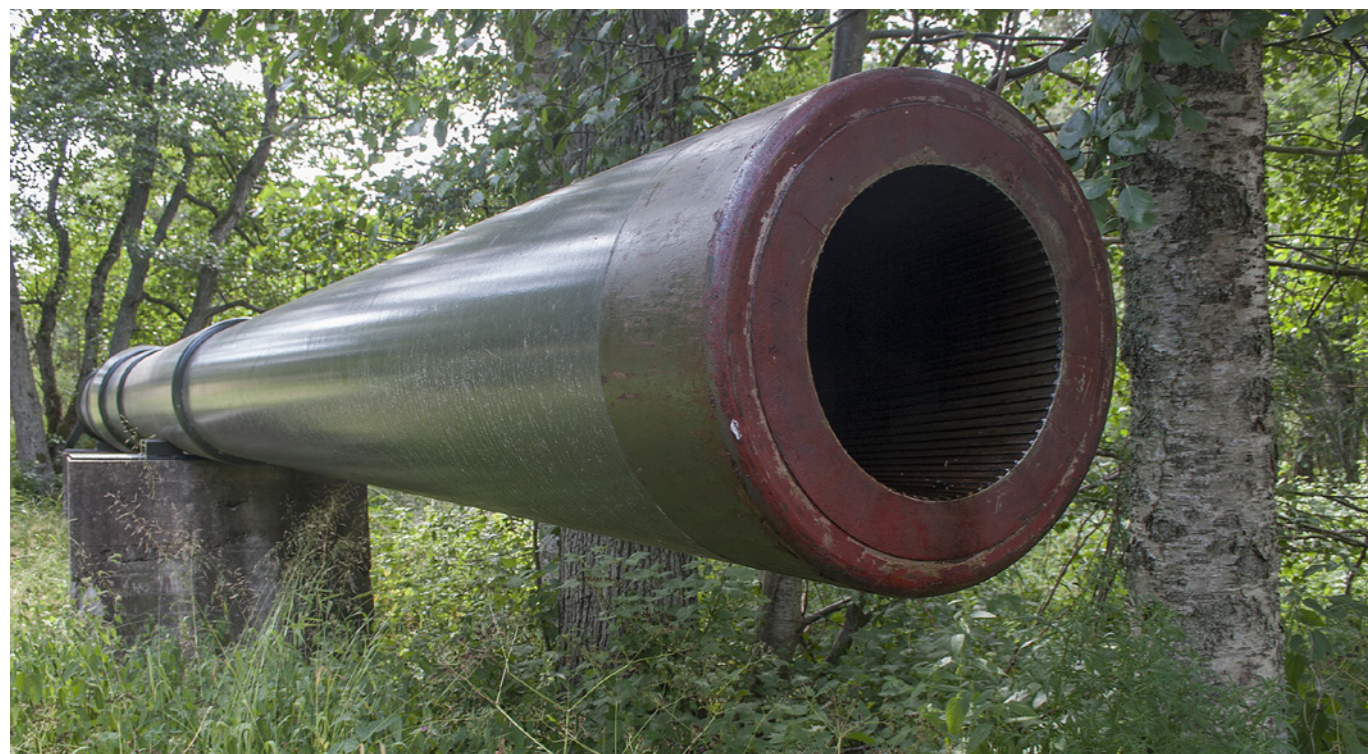
Örös 12 tums Obuhov-kanoner är massiva pjäser. Räckvidden var över 40 kilometer...