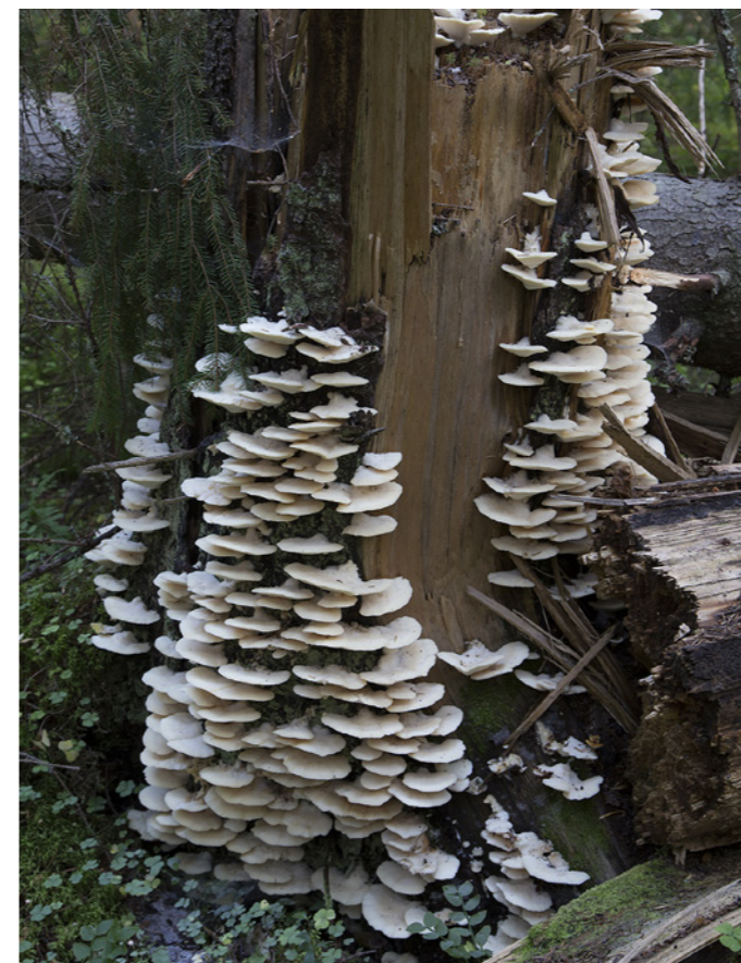
Svampexkursionen i september 2014 bjöd bland annat på den här präktiga kolonin av trädtkor nära Stormossen.