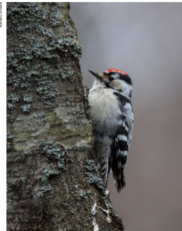
Den här mindre hackspetten med värkänslor mötte deltagarna på vårvandringen i april 2015 i Vik.