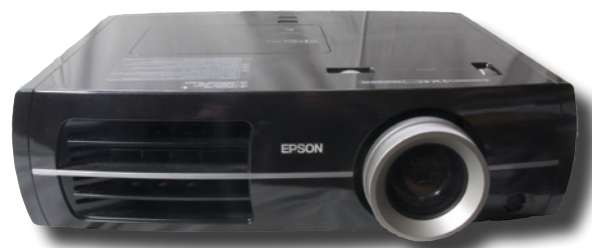
Kamera-67:s Epson bildprojektor är nyservad.