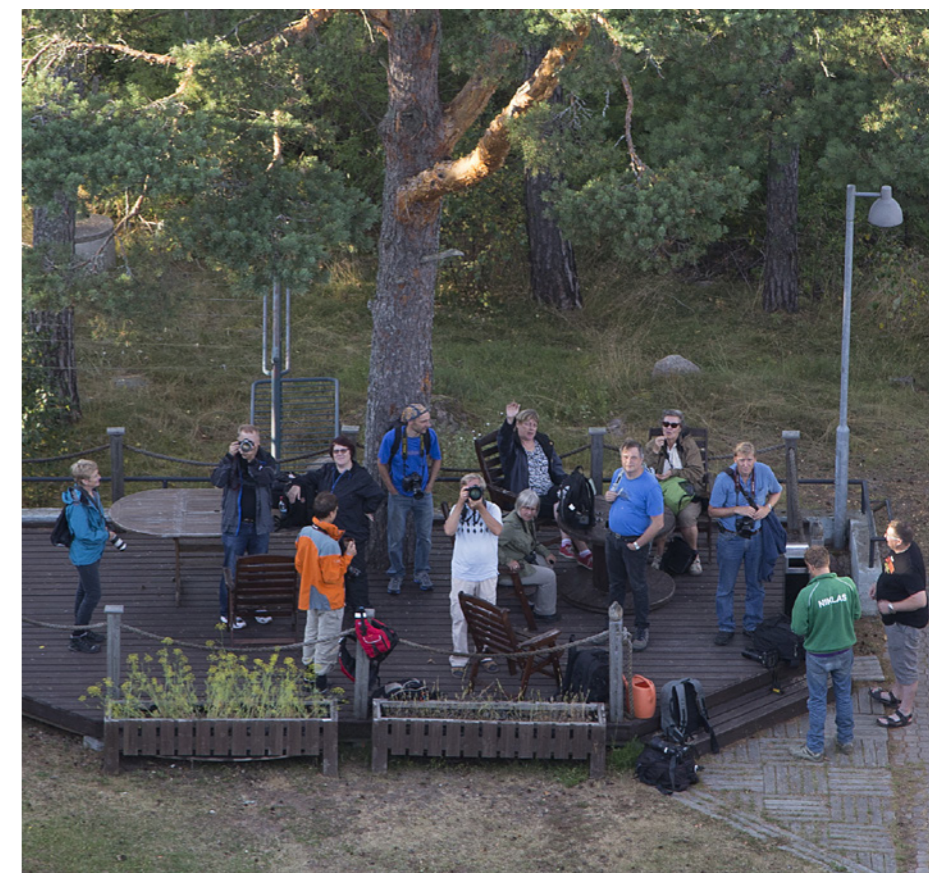
Förra årets Pellinge-exkursion var populär. Här är deltagarna fotograferade uppifrån sjöbavakningstornet på Glosholm.

Preliminärt den 11 oktober i Noux nationalpark och besök i naturcentret Haltia. Alternativt Bosgårds naturstig i Borgå.