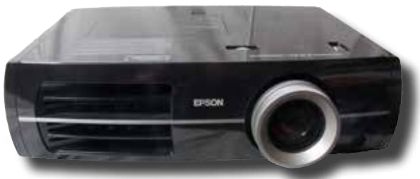
Kamera-67:s Epson bildprojektor är nyservad.