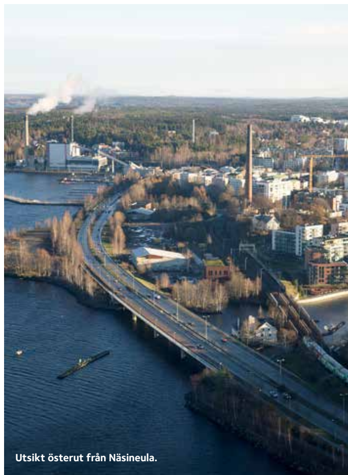
Utsikt österut från Näsineula.

Preliminärt har vi tänkt oss en vandring i Noux nationalpark i norra Esbo. Samtidigt bekantar vi oss med Fortstyrelsens nya naturcenter Haltia. Plats och tid meddelas senare per mail och Facebook.